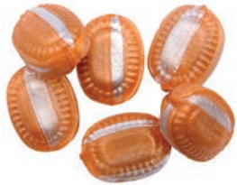
Art.-No.: 323 Sanddorn gefüllt Sea buckthorn filled