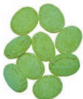
Art.-No.: 147 Wellness Lemongras Wellness lemongras