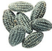
Art.-No.: 118 Spitzwegerich Plantain