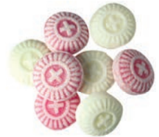
Art.-No.: 135 Orientalische Pfefferminz- Drops Oriental peppermint drops