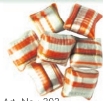
Art.-No.: 303 Espresso gefüllt Espresso filled