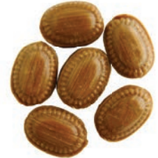
Art.-No.: 317 Milch-Rum gefüllt Milk & rum filled