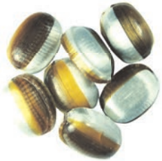
Art.-No.: 311 Mokka-Bohnen gefüllt Mocha beans filled