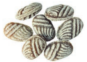
Art.-No.: 106 Eukalyptus Menthol Eucalyptus menthol