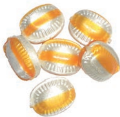
Art.-No.: 326 Schoko-Orange gefüllt Chocolate & orange filled