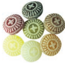
Art.-No.: 127 Hustenkreuze Cough crosses