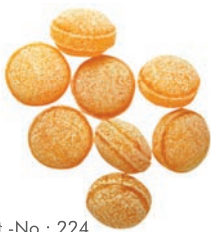
Art.-No.: 224 Pfirsich-Prosecco Peach champagne