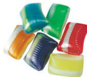
Art.-No.: 206 Messbrocken Swabian fair sweets