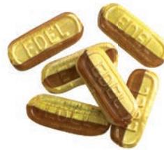
Art.-No.: 327 Nougat-Stäbchen gefüllt Nougat bars filled