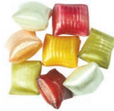
Art.-No.: 313 Fruchtige Seidenkissen gefüllt Silken fruit pillows filled