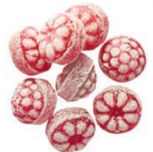
Art.-No.: 205 Himbeeren Spezial Raspberry special