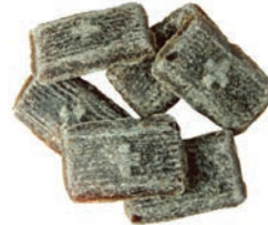
Art.-No.: 391 Brustkreuze Breast crosses (lozenges)