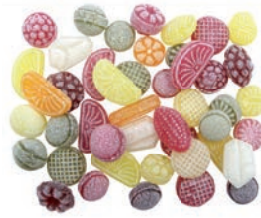
Art.-No.: 202 Früchte-Mischung „Bavaria“ Fruit Mix „Bavaria“