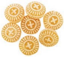
Art.-No.: 100 Anis-Drops Aniseed drops