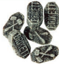
Art.-No.: 102 Anis-Fenchel-Brikett Aniseed fennel briquettes