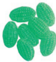
Art.-No.: 787 Caipirinha-Bonbons Caipirinha candies