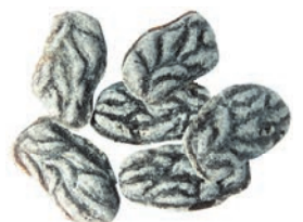
Art.-No.: 121 Zwetschge Dried plum