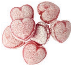
Art.-No.: 109 Glühwein-Herzchen Mulled claret hearts