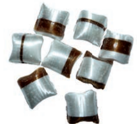
Art.-No.: 329 Cappuccino-Kissen gefüllt Cappuccino pillows filled