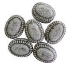
Art.-No.: 318 Lakritz-Anis gefüllt Liquorice & aniseed filled

Eduard Edel GmbH Bonbonfabrik Am Zollfeld 3 D-86609 Donauwörth Deutschland / Germany