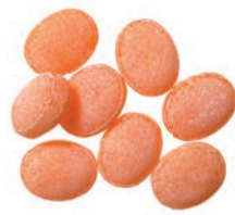
Art.-No.: 148 Wellness Sanddorn Aloe Vera Sea buckthorn aloe vera