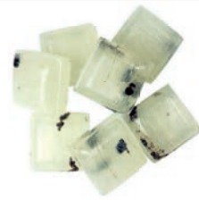
Art.-No.: 103 Chachou-Würfel Cachou cubes