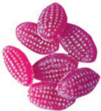
Art.-No.: 137 Lavendel-Entspannungs- Bonbons Lavender relaxation candies