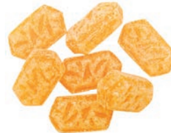
Art.-No.: 131 Ingwer-Orange Ginger & Orange