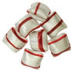
Art.-No.: 312 Pfefferminzkissen gefüllt Peppermint pillows filled