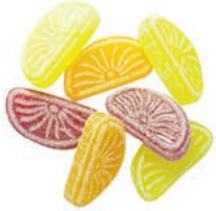
Art.-No.: 207 Orangen- & Zitronen- Schnitten Orange & lemon slices