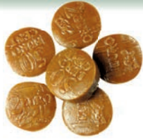
Art.-No.: 301 Vollmilch-Münzen gefüllt Whole milk coins filled