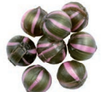
Art.-No.: 228 Apfel-Zimt-Kugeln Cinnamon & apple balls