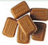
Art.-No.: 304 Lebkuchengewürz-Bonbons Gingerbread spice candies