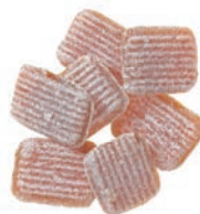
Art.-No.: 144 Ingwer pur Ginger „pure“