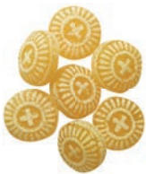
Art.-No.: 126 Melisse-Bonbons Melissa candies