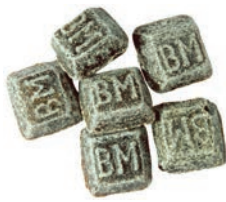
Art.-No.: 101 BM Bayrisch Malz BM Bavarian malt