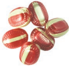
Art.-No.: 307 Glühwein-Bonbons gefüllt Mulled claret candies filled