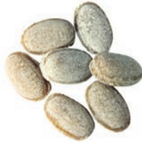
Art.-No.: 139 Thymian Thyme