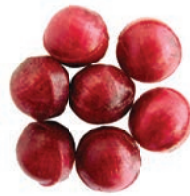
Art.-No.: 217 Wildkirsch-Kugeln Wild cherry balls