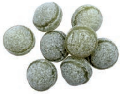
Art.-No.: 200 Apfel-Kugeln Apple balls