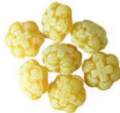
Art.-No.: 130 Kamille-Honig Chamomile & Honey