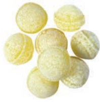
Art.-No.: 201 Birnen-Kugeln Pear balls