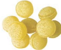
Art.-No.: 229 Bonbons mit Vanille- Geschmack Vanilla balls