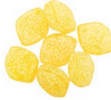
Art.-No.: 212 Zitrone Spezial Lemon special