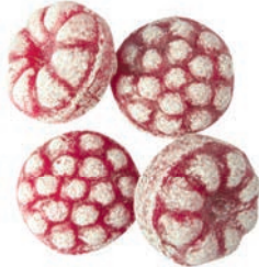
Art.-No.: 209 Riesen-Himbeeren Giant raspberries