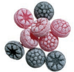
Art.-No.: 221 Waldbeeren-Mix Wood berry mix