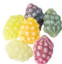
Art.-No.: 747 Weintrauben Grapes