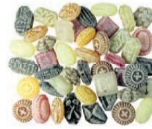
Art.-No.: 111 Husten-Mischung Cough assortment