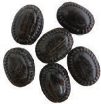
Art.-No.: 115 Lakritz-Drops Liquorice drops