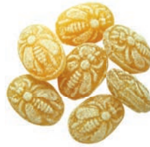
Art.-No.: 110 Honig- Bienen Honey bees