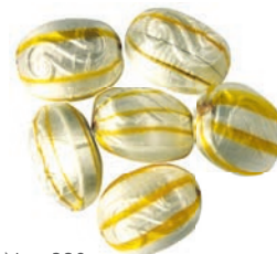
Art.-No.: 330 Marzipan-Schlüssel gefüllt Marchpane clefs filled