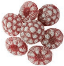
Art.-No.: 215 Brombeere Bramble