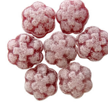
Art.-No.: 213 Schwarze Johannisbeere Black currant