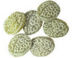
Art.-No.: 114 Latschenkiefer-Bonbons Dwarf pine candies