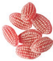
Art.-No.: 216 Walderdbeeren Wood strawberry