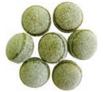
Art.-No.: 133 Grüntee-Apfel Green tea & apple