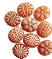
Art.-No.: 230 Bratapfel-Bonbons Baked apple candies