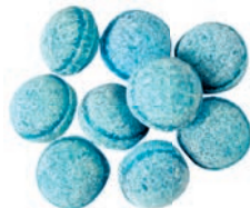
Art.-No.: 719 Minth blau Mint blue