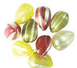
Art.-No.: 315 Stachelbeere gefüllt Gooseberry filled