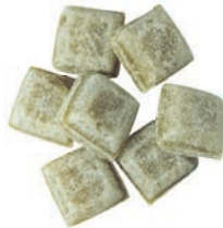
Art.-No.: 117 Salbei-Würfel Sage cubes