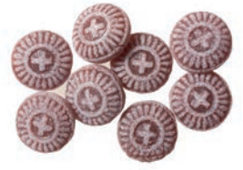
Art.-No.: 125 Baldrian-Bonbons Valerian candies