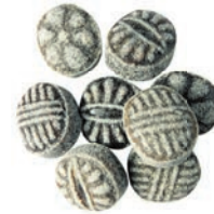
Art.-No.: 123 Siebenkräuter Seven herbs