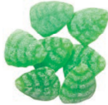
Art.-No.: 226 Bonbonblätter mit Waldmeister-Geschmack Woodruff leaves