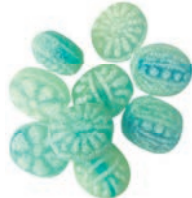
Art.-No.: 246 Arktis-Eis Arctic ice