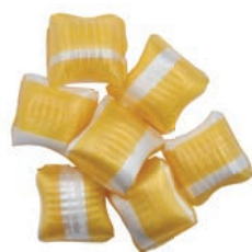
Art.-No.: 338 Eierlikör gefüllt Eggnog filled