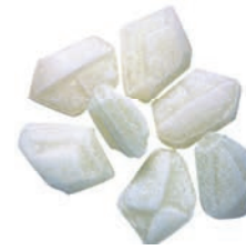
Art.-No.: 203 Blockeis Glacial ice rocks