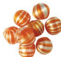
Art.-No.: 227 Zimt-Nelke-Kugeln Cinnamon clove balls