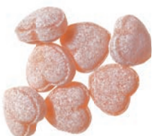
Art.-No.: 735 Cola-Herzen Cola hearts