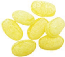
Art.-No.: 107 Fenchel-Bonbons Fennel candies