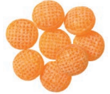
Art.-No.: 214 Maracuja Maracuja