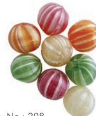
Art.-No.: 208 Pfefferminz-Kugeln Peppermint balls