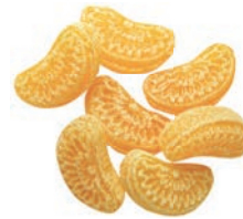
Art.-No.: 218 Mandarinen Tangarine