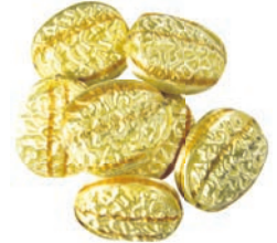
Art.-No.: 310 Seidenkracher gefüllt Silky almond bites filled