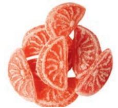
Art.-No.: 237 Spanische Orangen Spanish oranges