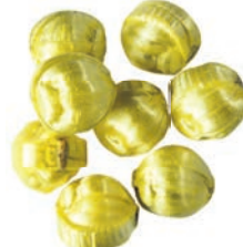
Art.-No.: 308 Goldnüsse gefüllt Golden nuts filled