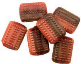
Art.-No.: 337 Chili-Schoko-Würfel gefüllt Chili & chocolate filled