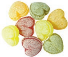
Art.-No.: 238 Sweet Hearts Sweet hearts