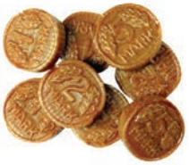
Art.-No.: 300 Vollmilch-Münzen ungefüllt Whole milk coins unfilled