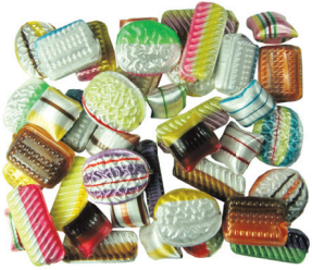
Art.-No.: 306F Schoko-Fourée gefüllt Chocolate fourée filled