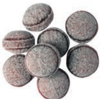
Art.-No.: 128 Holunder Elderberry