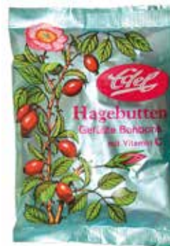
Hagebutte VC Rose Hip Candies Vitamin C

Mehr als Genuss: Edel Hagebutte werden mit echtem Hagebuttenmark gefüllt und mit Vitamin C angereichert.