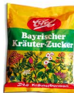
Bayrischer Kräuter-Zucker Bavarian Herbal Candies

Echt wirkt! Nach Bayerischem Originalrezept mit Gerstenmalzextrakt, Lakritz und Extrakten von 20 ausgewählten Kräutern sowie Menthol und ätherischen Ölen hergestellt.