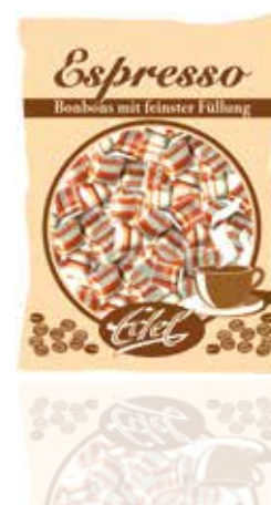
Espresso-Kissen Espresso Pillows

A sweet in the tradition of confectionary art from Vienna. Filled with genuine hazelnuts and cocoa and made nobly shining, this candy is a unique composition.