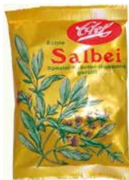
Salbei gefüllt Sage Candies filled

Wohltuend für Hals und Rachen - und Ihren Gaumen. Für unsere milden Salbei gefüllt wird noch echter Tee ausgekocht - das schmeckt man!