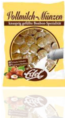
Vollmilch-Münzen Whole Milk Coins

Candy art in perfection! With love for the details. These fine filled candies have a strong and dainty chocolate taste