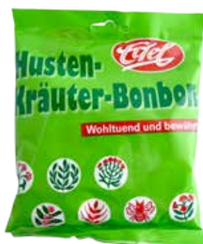
Husten-Kräuter-Bonbons Cough Assortment

Gesundes schmeckt nicht? Von wegen: Lassen Sie sich von der Auswahl unserer besten Kräuterbonbons helfen - und genießen Sie!