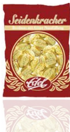
Seidenkracher Silky Almond Bites

The classy coin sweet with hazelnut filling and 40% fresh whole milk are also known as „Milk money“. A currency, that will never lose its worth!