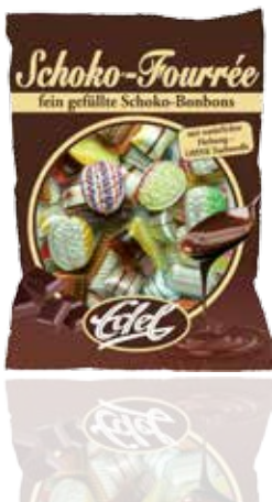
Schoko-Fourrée Chocolate Fournée

Feinste Bonbonkunst mit einer langen Tradition. Diese filigranen, bunten und glänzenden Bonbons sind einzigartig im Markt und ein Statement für handwerkliche Qualität und feinen Schoko-Genuss.