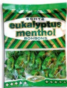
Eukalyptus Menthol Eucalyptus menthol

Das beste Eukalyptus-Bonbon von Edel. Ideal zum Durchatmen, ideal für unterwegs; Mit echtem Eukalyptus-Öl und Menthol hergestellt.